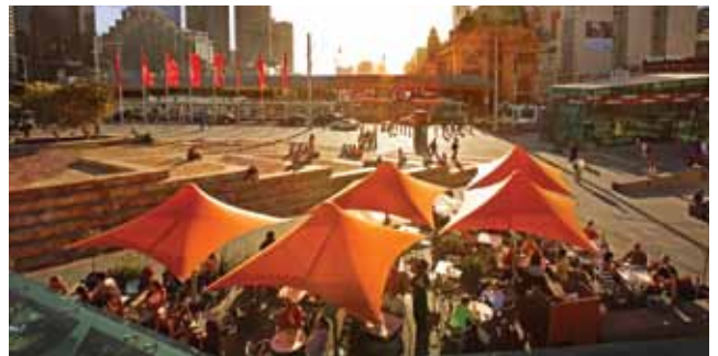
Quảng Trường Liên Bang