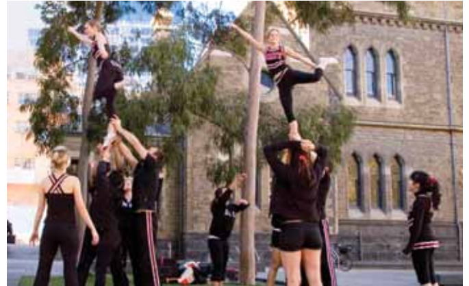
RMIT Nổi Kết Thể Thao và Giải Trí