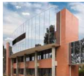
Ciudad universitaria de Bundoora