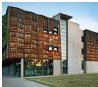
Ciudad universitaria de Brunswick