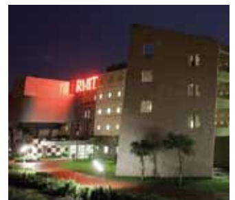
Universidad internacional RMIT de Vietnam