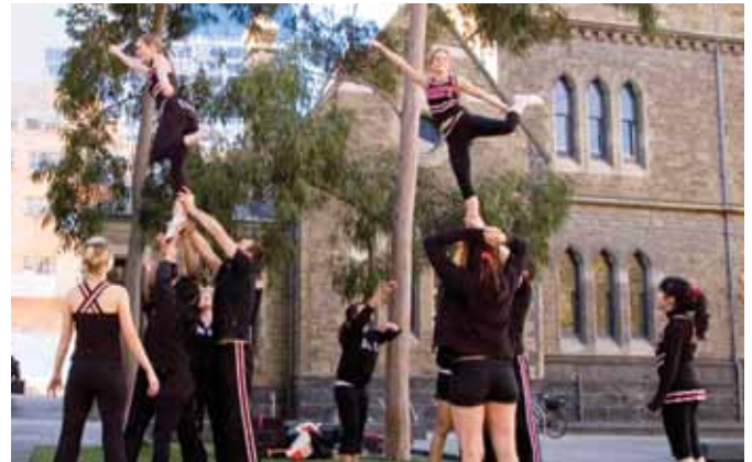
Deportes y recreación en RMIT.

En el arbolado suburbio de Bundoora, RMIT ofrece muchos de sus programas de ingeniería, salud y ciencias médicas. Las instalaciones punteras de RMIT están en medio de zonas verdes y enormes espacios abiertos que brindan a los estudiantes un entorno de tranquilidad. En la ciudad universitaria se destaca el laboratorio de salud y ciencias médicas especialmente diseñado y nuevos campos deportivos, incluyendo una cancha de fútbol acreditada por FIFA, campos de fútbol australiano, pistas de atletismo y canchas de tenis y netball.