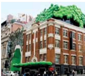
Ciudad universitaria de RMIT del centro