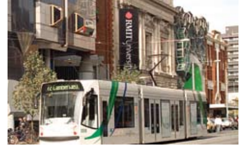
Kampus RMIT di City

www.rmit.edu.au/international/educationabroad