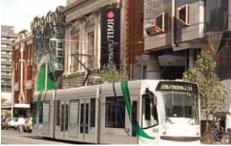
مركز جامعة RMIT الرئيس في وسط المدينة

www.rmit.edu.au/international/educationabroad